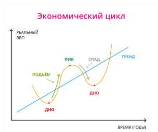
Рис.1. Экономический цикл

Краткосрочные колебания экономического цикла (подъём, спад) не являются экономическим ростом. Экономический рост (тренд) проявляется в долговременном увеличении ВВП.