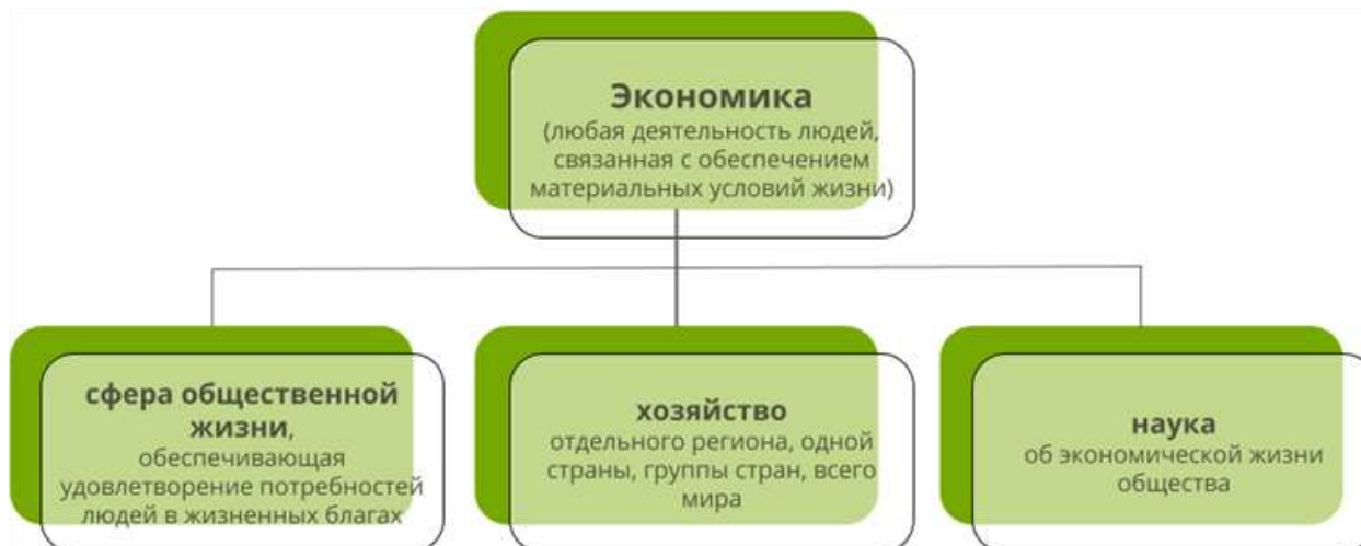
Рис. 1. Понятие экономики

Подводя итог, можно сказать, что понятие «экономика» имеет два разных, хотя и взаимосвязанных, значения.