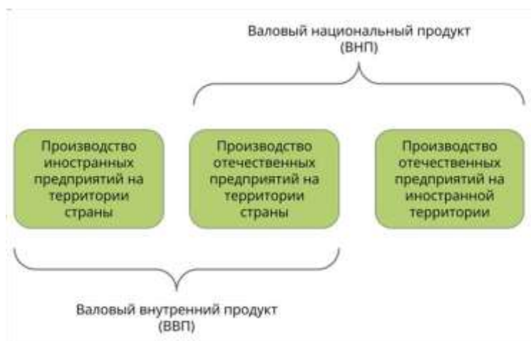
Рис. 1. ВВП и ВНП

ВНП отличается от ВВП только учётом территории производства